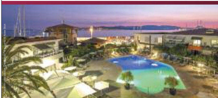
Hôtel la Marina Saint-Raphaël - Côte d'Azur

Au pied du massif de l'Esterel, face à la grande bleue