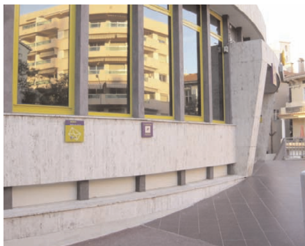
Accès à la POSTE

215 Av du Maréchal Lyautey - Tél. 04 98 11 00 00