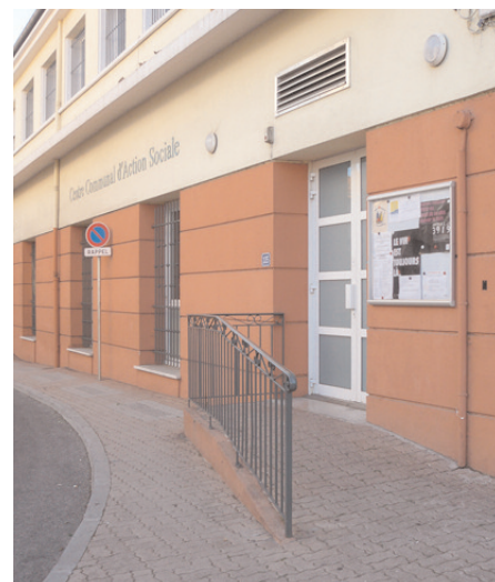
Accès au CCAS