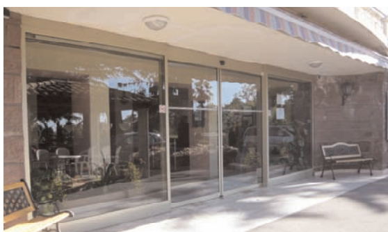
Accès à la Clinique Notre Dame