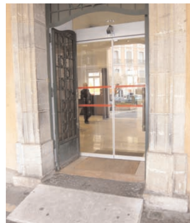
Accès à l'Hôtel de Ville